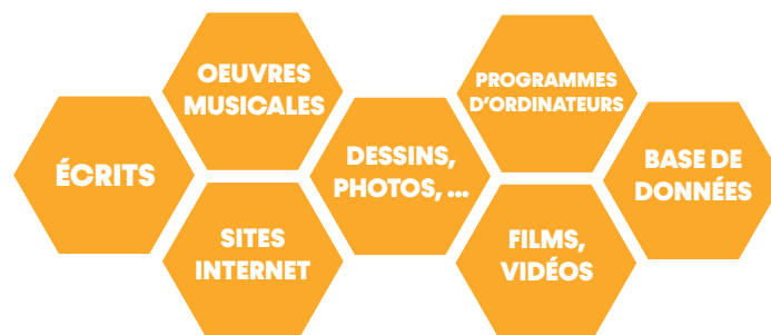
Fig.1 : Exemples non exhaustifs de créations protégeables automatiquement par le droit d'auteur